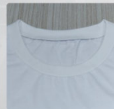
实际效果 Actual effect