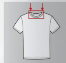
上圆领工艺图 Upper round neck process drawing

Jersey, Pique and Lycra round neck or sleeve cuff.