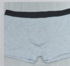
实际效果 Actual effect