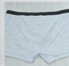
实际效果 Actual effect