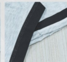
实际效果 Actual effect